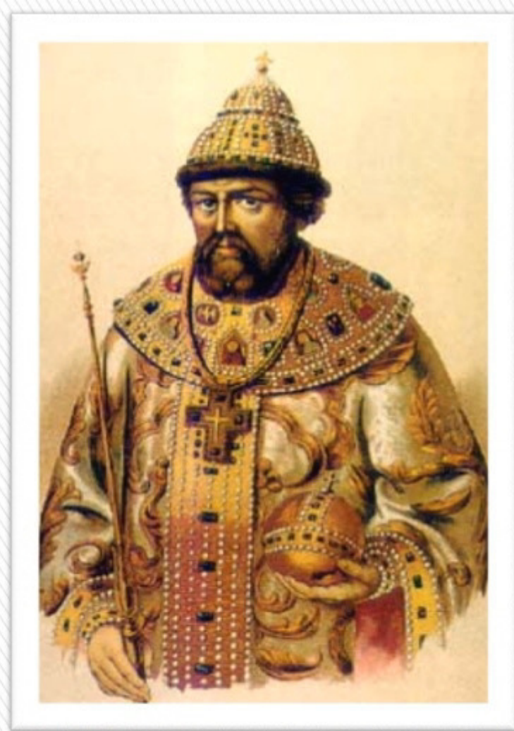
Алексей Михайлович 1645-1676 гг. ➤