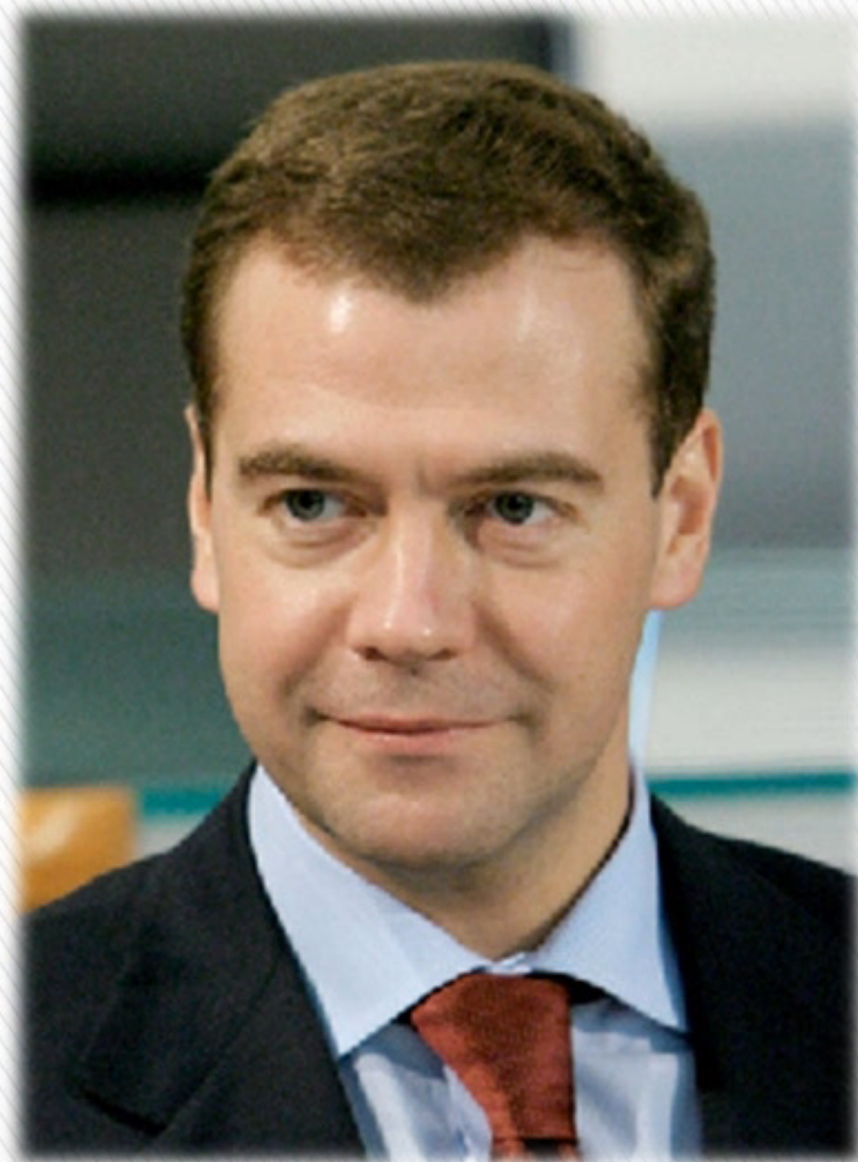
Д.А. Медведев > 2008-2012

В целях борьбы с коррупцией в России в июле 2008 г. Президентом РФ был утверждён Национальный план противодействия коррупции.