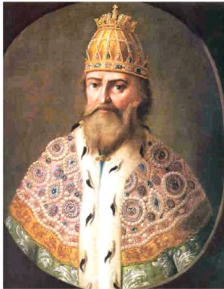
Иван IV Грозный 1533-1584гг.➤

«... подьячего казнити торговую казнью, бити кнутьем»