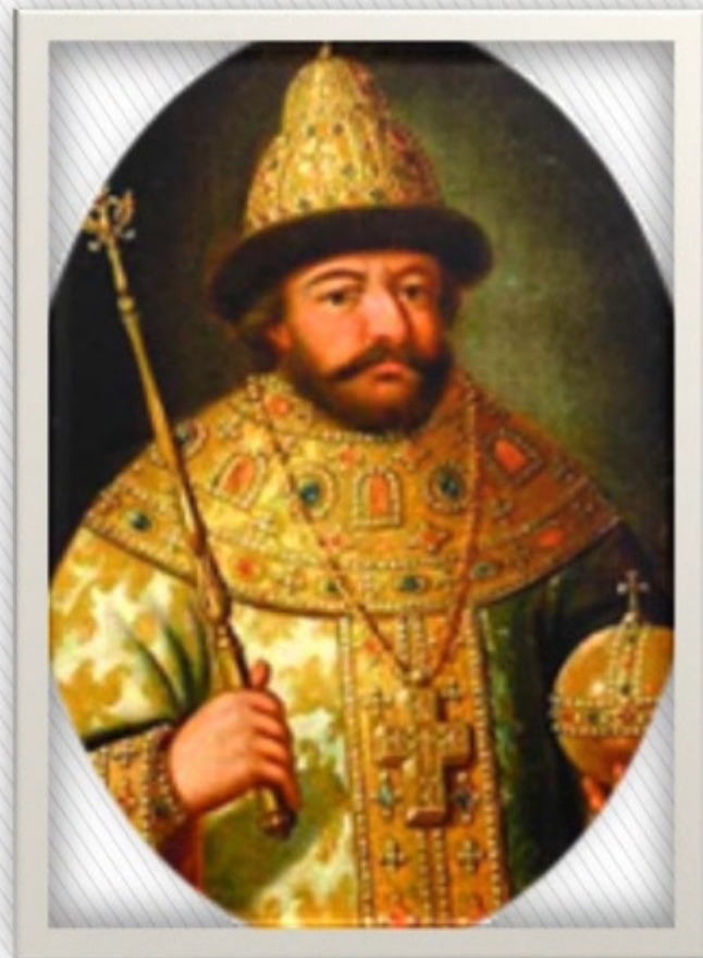
Борис Годунов 1598-1605гг. ➤