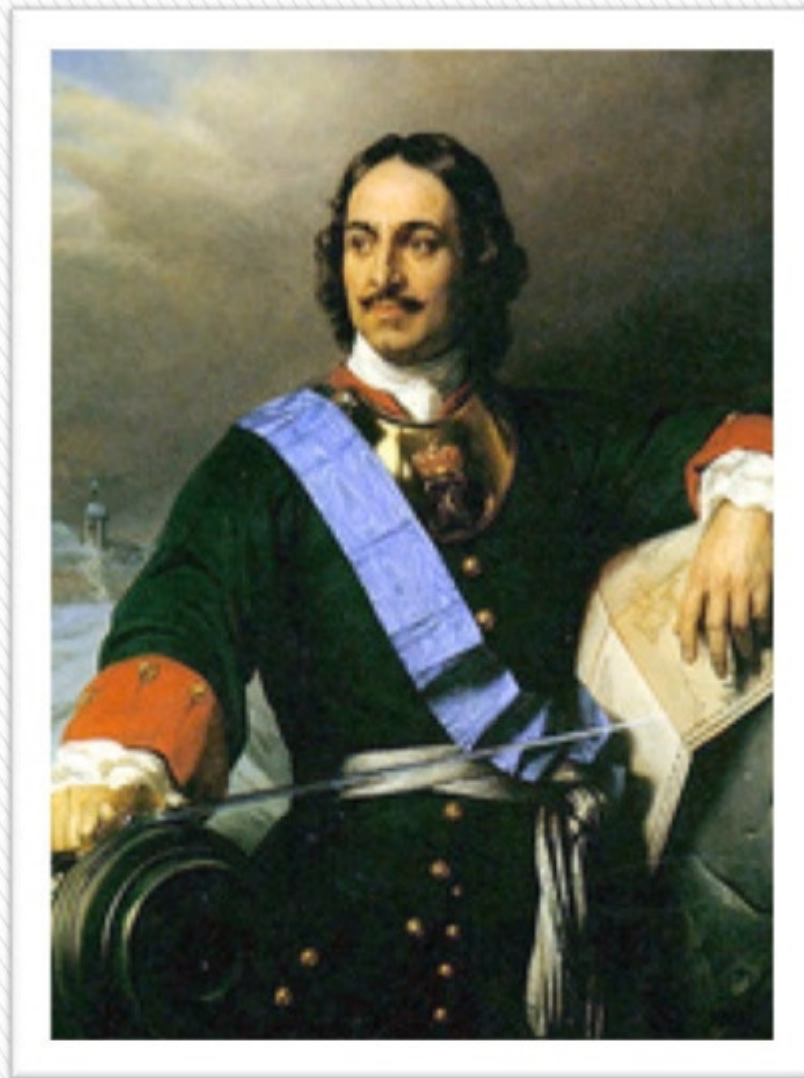
Петр I ➤ 1682-1725