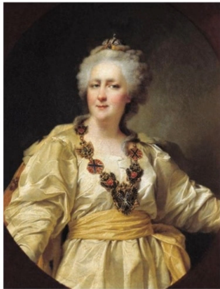
Екатерина II 1762-1796гг.

В целях профилактики коррупции кроме жалования после 35 лет службы назначалась пенсия